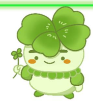
子どもと親のサポートセンターキャラクター