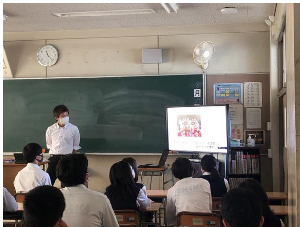
各教室でモニターやスクリーンに映し出される校長先生の話などを聞きました。

本校は、二期制のため、夏季休業前後に終業式や始業式は実施していません。(10月の秋季休業前後に行います) その代わりに、夏季休業前後に集会を実施しています。全日制と午前部・午後部の夏季休業明け集会は、暑さとコロナ感染対策のため、今回リモートで実施しました。