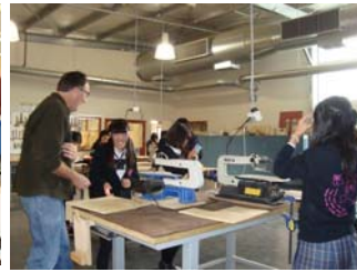
木工(ブーメランの作成)