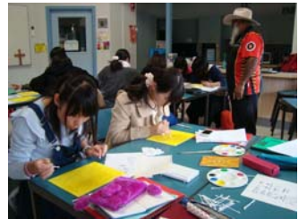
アボリジニアート体験