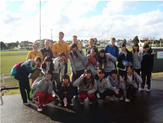
学校グラウンドにて