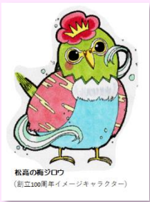
松高の梅シロウ (創立100周年イメージキャラクター)