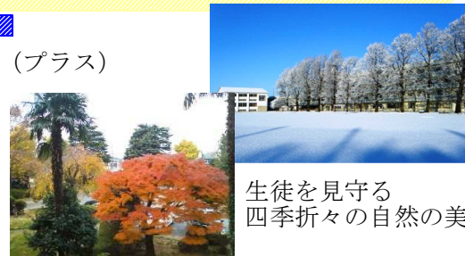
生徒を見守る 四季折々の自然の美

四年制大学も一般受験で筑波大・独協大・東洋大・駒澤大・専修大・成城大・日本大・国土館大・多摩美大などに合格。推薦入試では、國學院大・文教大・東京工芸大・杏林大などに合格しています。また、専門学校も慈恵柏看護専門など医療系の進学は13名です。その他には、劇団青年座に進む生徒も含まれています。