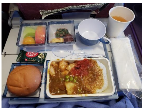
チキンカレーの様子