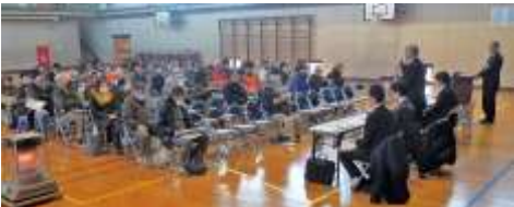
住居表示説明を聞き入る皆さん

1月27日(日)に稲越小学校体育館に於いて稲越地域の住居表示実施に関する説明会が行われました。当日は気温が低く又風の強い日でしたが多くの会員の皆様約100名が傍聴にいられ熱心に説明を聞かれました。此の住居表示作業は市川市も数十年ぶりの作業で経験者がおられず今回の担当者の皆さんも如何に多くの皆さんの意見を聞き完成度の高い住居表示を完成させるのに苦労は厭わないと言われておられました。