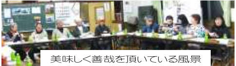
美味しく善哉を頂いている風景