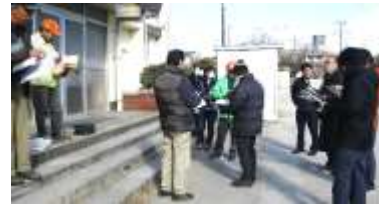
訓練前役員参集訓練手順を聞く風景

1月20日稲越小学校体育館で防災協議会の地域役員8名と市防災役員5名で参集役員が少なかった中訓練が行われました。このような訓練をもっと地域密着型に改善して会員の皆さんも参加して有事型の訓練にしていきたいものです。