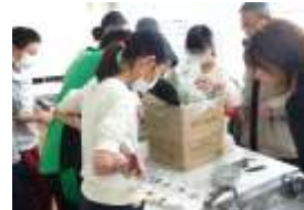
説明書を見ながらの作業進行

12月5日に稲越小学校区防災拠点協議会が行われました。今回は、1月20日に各小学校区で防災拠点訓練が行われる各班シナリオの打合せ会議。各班とは【総務班・情報班・施設管理班・食糧・物資班・保健・衛生班・要配慮者班】の6班、稲越小学校体育で午前9時から行います。※今回は役員だけの訓練ですが興味ある方は是非見学に来て下さい。※