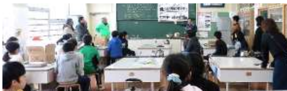
体験訓練に入る前の教頭先生のお話を聞く生徒たち

最初に教頭先生から訓練に対する心構えや災害時に自分たちは何が出来るかなどのお話があり、そのことを考えながら炊き出し食の作業に取り掛かり、炊き出しセッ