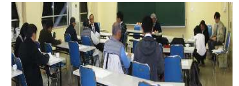
各班に分かれ訓練シナリオの打合せ風景

トの説明書を見ながら悪戦苦闘しながらでも何とか出来上がりました。試食した生徒たち“うまい”と言っていました。※アルファー米は10食程度の物も販売しているようです、家庭でもやってみてください。