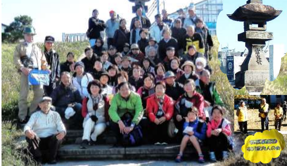
2018-11-25 歩こう会 14弾 総勢 54名 妙典・行徳方面回遊記念