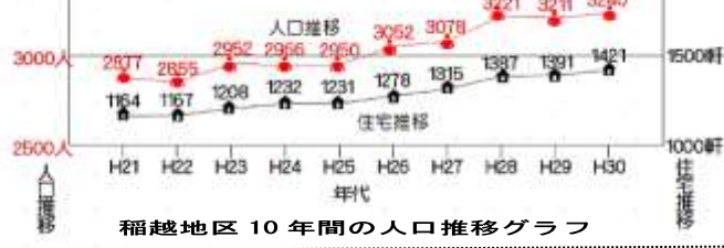
稲越地区 10 年間の人口推移グラフ