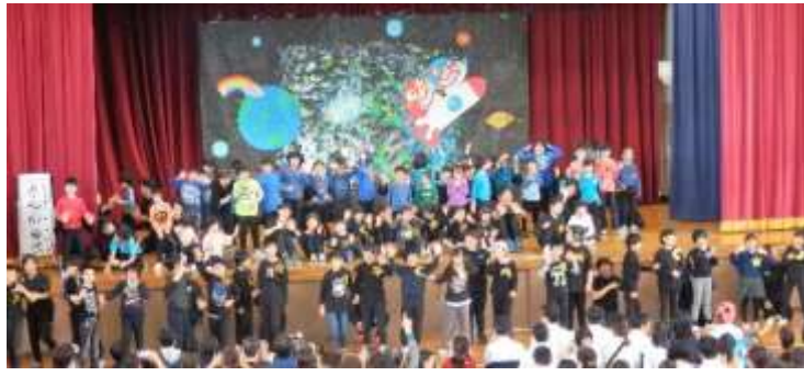
低学年が自分達で製作した垂れ幕の前で発表後の挨拶。

又舞台ではレコンバンド(社会福祉法人)・STREETJAM(ストリートジャム)・国分高校バトン部のショーがあり会場内は頒布会と合わせてねつきがあらわれていました。