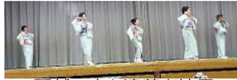
稲越の方も演芸を披露

午前 10 時に式典が始まり会長の挨拶にご来賓の挨拶並びに紹介、式典終了後午前の部の演芸が始まり、各地域の方々が日頃練習と鍛錬された成果を会場に来られた皆さんに披露され和ませて下さいました。午後の演芸との合間に高齢者サポートセンター国分の担当者が手話で皆さんの知っている歌”故郷”を参加者の皆さんに指導しながら歌にわばった体をほぐし午後の部の演芸も楽しく楽しむことが出来ました。演芸の最後は孫のような可愛い少女たちのフラダンスチーム (M,W,U,M) が舞台いっぱい花を咲かしてくれました。