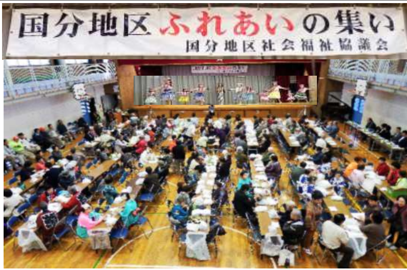
ふれあいの集いを楽しんでおられる会場風景

平成 30 年度の国分地区社会福祉協議会主催のふれあいの集いが 10 月 21 日(日)に中国分小学校体育館で役員含め約 400 名の参加で開催されました。