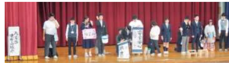
自分達の製作した頒布品のピーアール発表