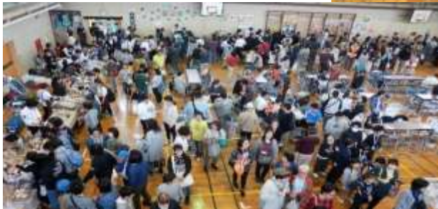
会場内は頒布会に来られた人々でごった返す風景