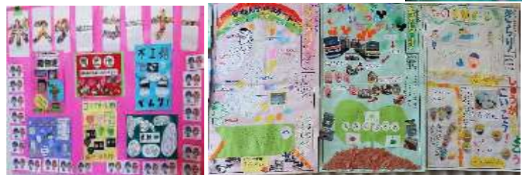
各班の頒布品ポスター 市川市学校新聞展に出品し優秀賞受賞