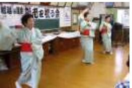
日頃の鍛錬を皆さんに披露