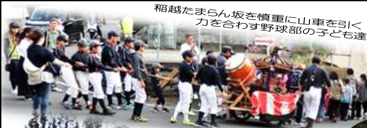
稲越たまらん坂を慎重に山車を引く力を合わす野球部の子ども達