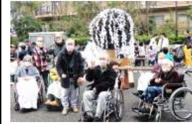
老人ホームオワノの老人たち神輿をバックにパチリ。