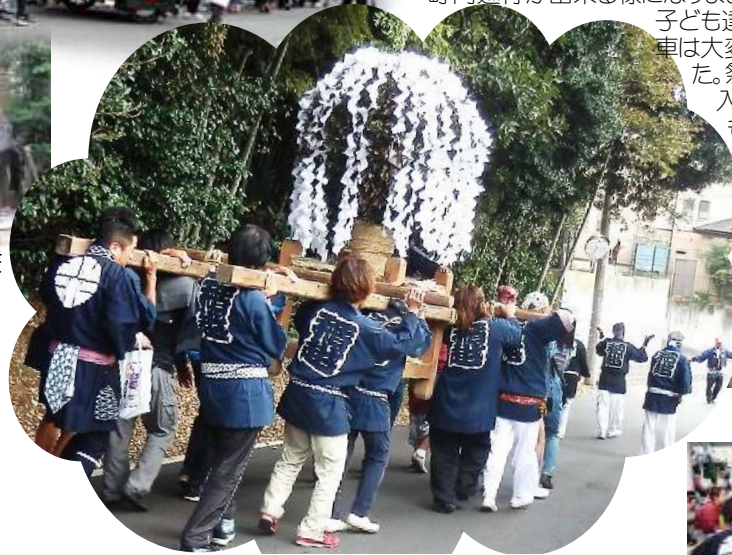
最後の踏ん張りは稲越の親父たちの出番