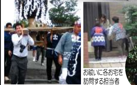
お祝いに各お宅を訪問する担当者

10月14日(日)に稲越子ども会育成会主催の稲越子ども会秋祭りが開催されました。今年の前夜の雨が朝方まで残り祭りの決行が危ぶまれましたが、宮出するころには空の雲も切れ始めて町内巡行が出来る様になりました。今年は野球部の子ども達の参加があり子供山車は大変賑やかな巡行ができました。祭りもさき神輿の宮入りが無事終わり、事故もなく無事祭りを終えることが出来ました。