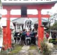
宮入りで最後の頑張り神輿も踊る