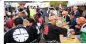
直会・皆さんほっとする