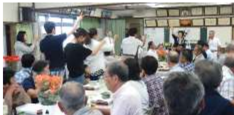
昨年に引き続き稲越小学校校長先生のリードのジャンケン大会でお花の分配