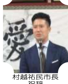
村越祐民市長 祝辞

稲越自治会恒例の自治会の新役員(本部理事・地区理事・組長)と平日頃お世話になっているご来賓の方及び地域で活動されている各種の役職の方を交え総勢 78 名で総合懇親会を 6 月 3 日に開催しました。