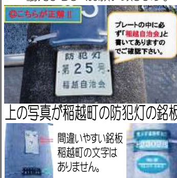
上の写真が稲越町の防犯灯の銘板

防犯部では稲越町の環境保全のための防犯灯を主に維持管理行っています。町内には 400 灯以上が設置してあります。担当者だけでは目が届きません、会員の皆さんが不備を発見されましたら本部理事・地区理事・組長さんに連絡下さい。協力よろしくお願ひ致します。