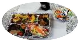
オードブルとお弁当を 合わせ折詰 お土産にあんみつ!