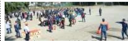
各部署での訓練風景