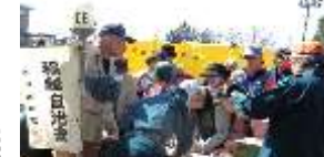
会場で避難者カード記入