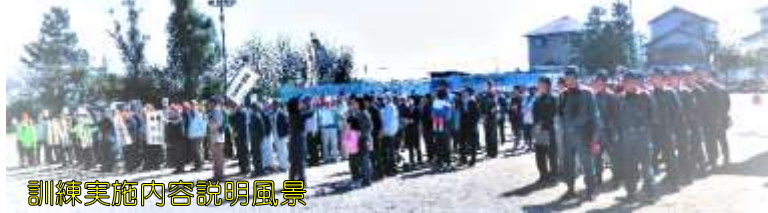
訓練実施内容説明風景