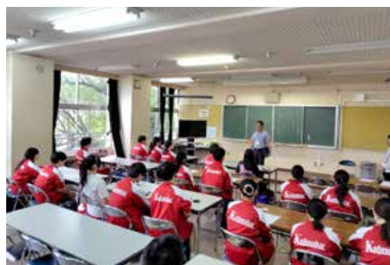
中学校での指導体験