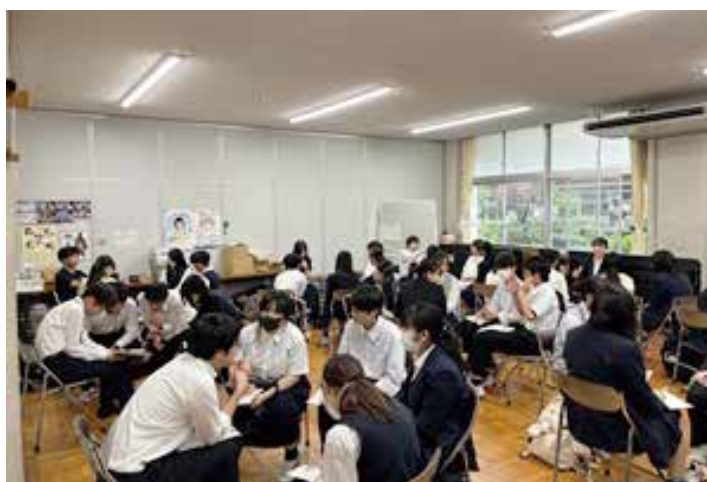
指導案の検討研修