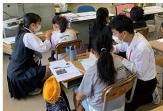
小学校での指導体験