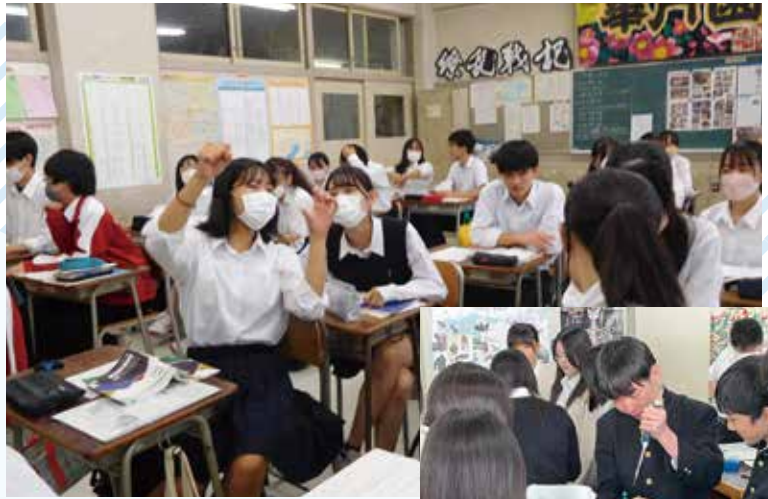
話し合いや発表を重視した授業

校内外を問わず様々な取組を実施し、学力向上やキャリアデザインのために役立たせます。大学進学をはじめ進路実現へのサポートはもちろん、学ぶことの面白さや学習内容に興味を感じることを大切に、主体性（＝自分で考える、自分で決める）を重視した授業や教育活動を展開しています。大学等関係機関との連携も充実しており、あなたの「学びたい!」「(理想の自分)になりたい!」という気持ちに応えます。