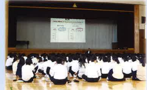
手厚いキャリア教育