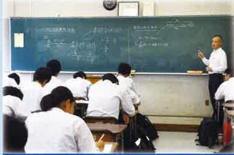
理系大学進学対応