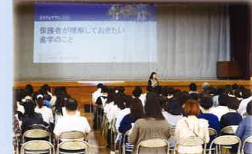
保護者対象進路説明会