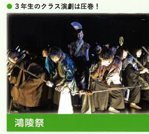
● 3年生のクラス演劇は圧巻！ 鴻陵祭

多様な学校行事を通して、生徒一人ひとりが輝ける舞台を創出しています。仲間との人間関係を築いていくだけでなく、各行事を通して自らと向き合い、自分自身の特性に気付くこともできます。