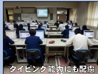
タイピング能力にも配慮