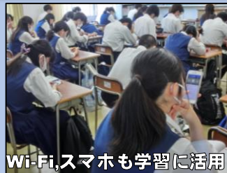
Wi-Fi,スマホも学習に活用