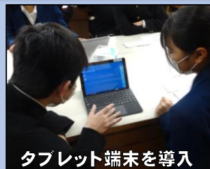
タブレット端末を導入