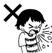
何もせずに せきやくしゃみをする