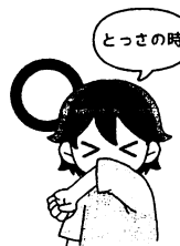
袖で 口・鼻をおおう