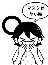
ティッシュ・ハンカチで 口・鼻をおおう