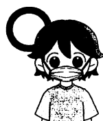
マスクを着用する (口・鼻をおおう)