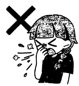
せきやくしゃみを 手でおさえる