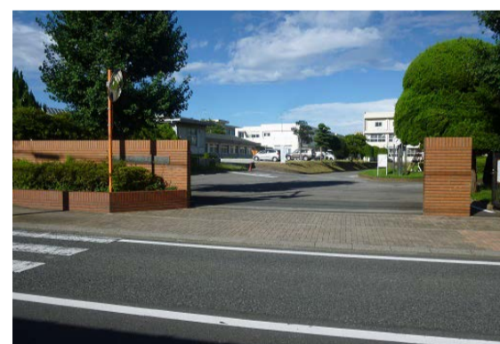
⑫京葉工業の正門に到着しました。