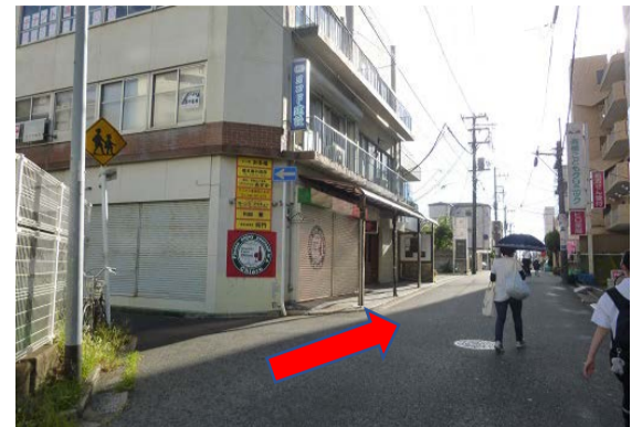
③ここを左に行くと千葉女子高生の通学路(女子高道)です。京工生は直進します。(工業道)