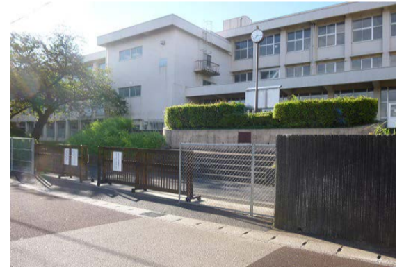
⑨生徒通用門です。門を入り階段を上がる昇降口です。そのまま直進して正門に向かいます。