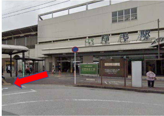
①JR稲毛駅東口を出てバス停1番乗り場を左に見ながらパチンコ屋を右に見ながら直進してください。

バスをご利用の場合は「園生交差点」で下車してください。下車後道路を渡り「SUZUKI自動車」を右折してください。