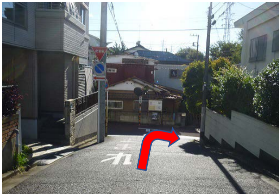
⑤緩い下り坂です。丁字路を右折してください。ここを左折するとバス通りです。