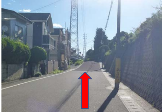
⑧緩い上り坂です。車に気を付けて直進してください。