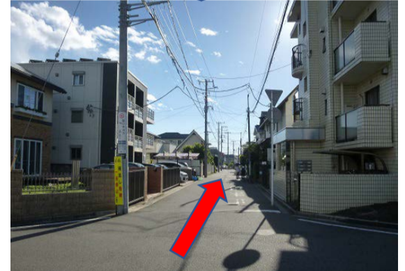
④約600m⑤のポイントまでひたすら直進してください。ここを左折すると女子高の正門です。