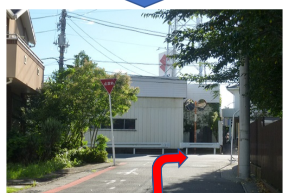
⑩学校のフェンスに沿って直進します。丁字路を右折します。