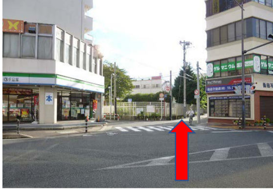
②吉野家の前の信号を不動産屋とファミリーマートの間の道に直進してください。