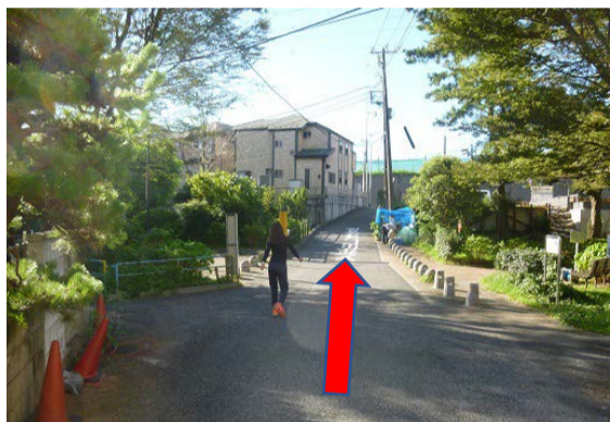
⑥小園公園の中を通る道を進みます。学校が見えてきます。