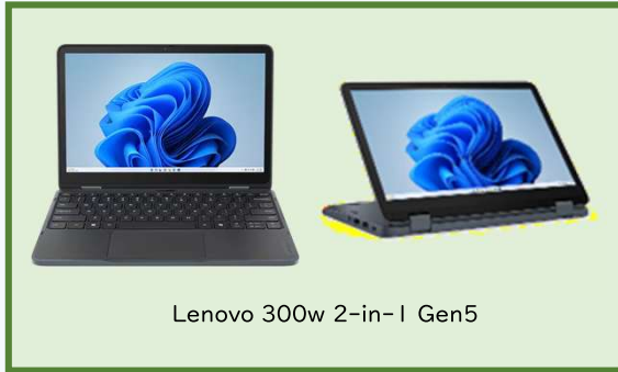
Lenovo 300w 2-in-1 Gen5