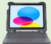
Brenthaven Rugged キーボードケース iPad A16/第10世代