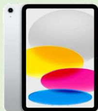
Apple iPad (A16) 11インチ