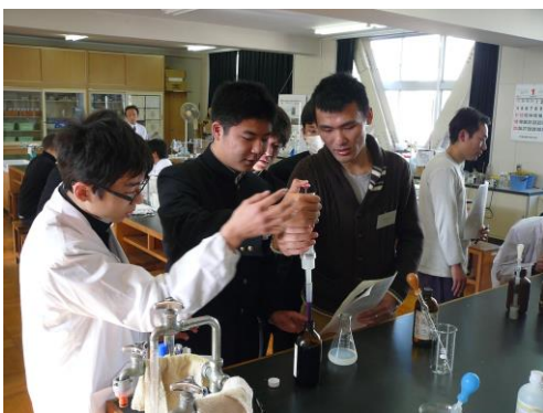
COD 測定を真剣に行っています。

本校は毎年夏にアメリカ ウィスコンシン州のコンコル ディア大学で理数科生徒を中 心に研修を行っています。そ こでは手賀沼などの水質問題 の発表（パワーポイントを使 って英語で発表）や、現地で の調査活動などを行っています。 詳しくは理数科ニュース に報告がありますので、そち らをご覧ください。