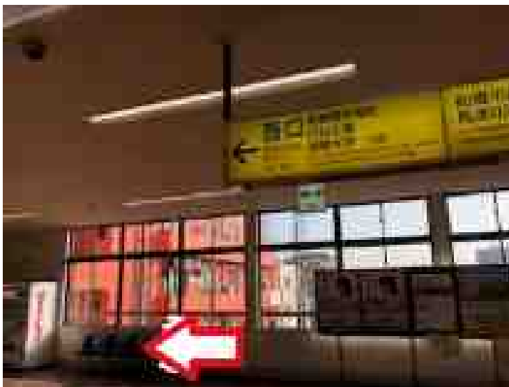
改札を出たら西口方面へ