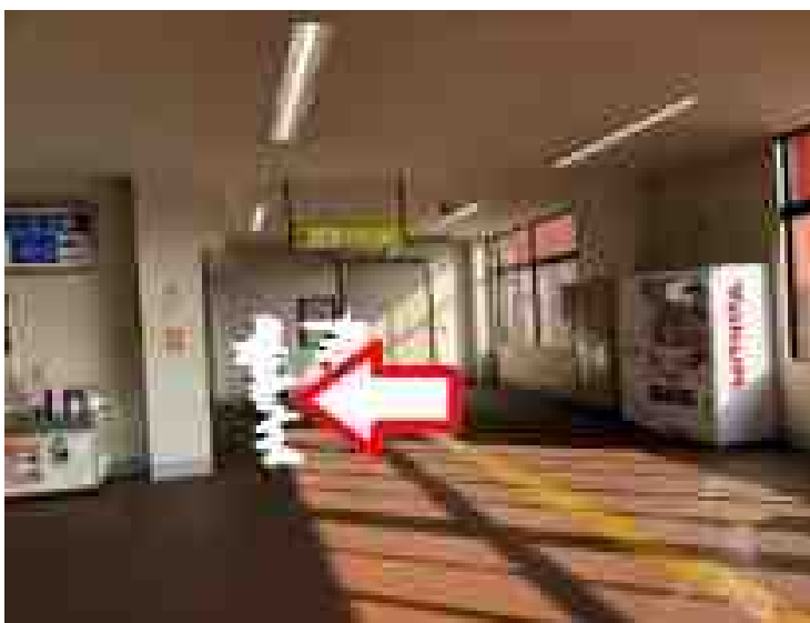
西口へは階段を下りて向かいます