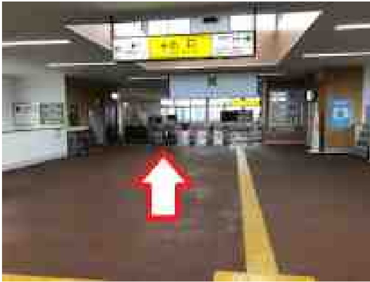
塚田駅の改札は一つです