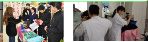
高等部専攻科（理容科）