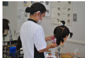
高等部理容科 理容実習を通して地域と繋がっています。