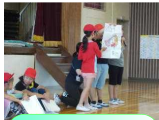
近隣の小・中・高等学校・専門学校との学校間交流を行っています。