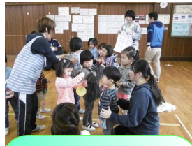
幼稚部 縦割り交流活動 「なかよし会」