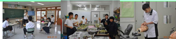
高等部（普通科・産業技術科・理容科）