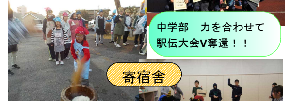
中学部 力を合わせて 駅伝大会V奪還！！