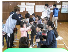
幼稚部 縦割り交流活動「なかよし会」

平成29年度から千葉聾学校のキャラクターに決まった「ギンタロー」です。子どもたちがキャラクターを考え、投票で決めました。