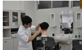
高等部専攻科理容科 福祉施設での散髪ボランティアをしています。