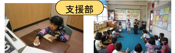
聴力測定・通級指導教室「サマーコミュニケーションスクール」

早期から聴覚の活用を基盤にキード・スピーチや手話など視覚的な手段を多用し、人と関わる楽しさを体験しながら、ことばの獲得につなげています。一人一人の障害の状態に応じて、確かな言語力とコミュニケーション能力の基礎を築くための自立活動を土台に、わかる・できる授業で子どもたちの自立と社会参加を目指しています。また、支援部では、校外外と連携して、教育相談や通級による指導等を行っています。教育相談についてはホームページをご覧ください。