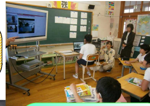
近隣小学校との遠隔地教育による交流授業。