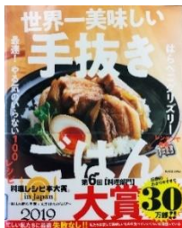
「世界一美味しい手抜きごはん」KADOKAWA