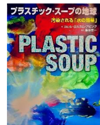
「プラスチック・スープの地球」ポプラ社