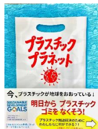
「プラスチック プラネット」評論社