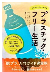
「プラスチック・フリー生活」NHK 出版