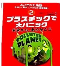
よごれた地球「プラスチックで大パニック」創元社