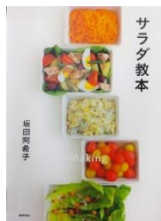
「サラダ教本」東京書籍