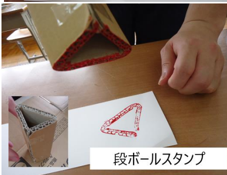
段ボールスタンプ