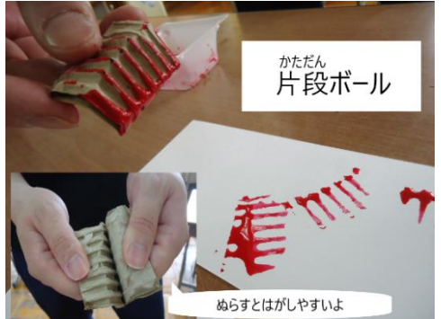
かたたん 片段ボール