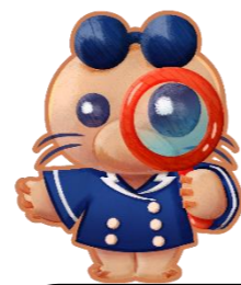
千葉盲学校 マスコットキャラクター ちばモグちゃん

タブレット端末を使用して教科書や図書等の読み上げや拡大のできるアプリを紹介しています。また、使用するための申請方法や使い方等についての指導・支援も行っています。