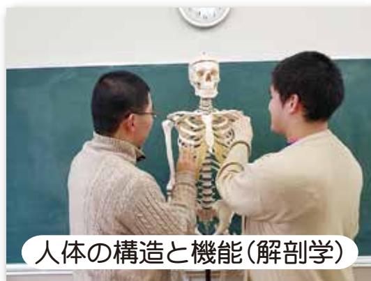
人体の構造と機能(解剖学)

基礎理療学・理療基礎実習・理療臨床実習・課題研究・臨床理療学・地域理療と理療経営