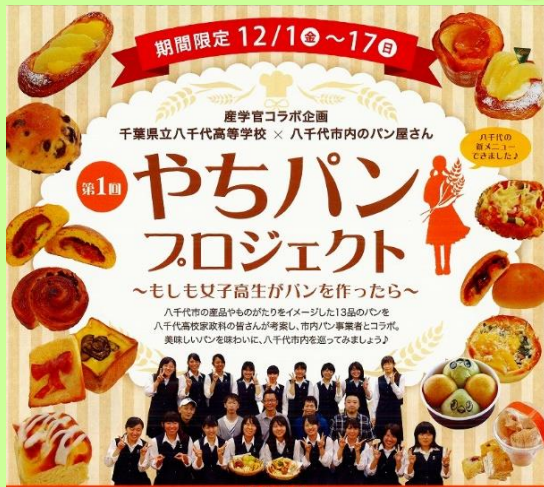
2017年度第1回ポスター

「やちパンプロジェクト」とは 家政科生徒が、八千代市内のパン職人とともに オリジナルパンを考案・販売するプロジェクト